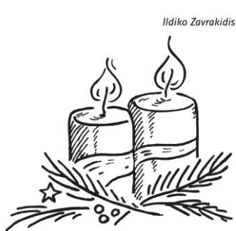
2. Advent: Die Erwartung wecken