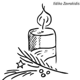
1. Advent: Die Umkehr wagen

17:00 WortGottesFeier mit Vorstellung der Kommunionkinder